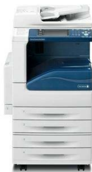
Hình ảnh mang tính chất minh họa.